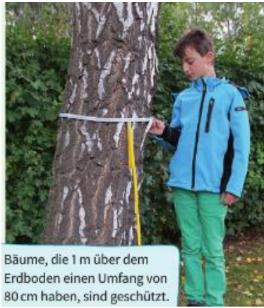
Bäume, die 1 m über dem Erdboden einen Umfang von 80 cm haben, sind geschützt.

Beim Kauf eines Fahrradhelmes spielt der Kopfumfang eine Rolle.